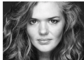
Kathrine Windfeld – European Rising Star