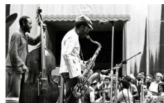
Jimmy Heath R.I.P.