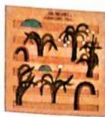
The Notwist Magnificent Fall Morr Music Elektro-Pop-Experimente ★★★★★