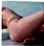
PVA No more like this It's all for Fun Trip-Hop ★★★★★

Shaw gelegentlich untergehen – plädiert »Secret Love« jedoch für Sanftheit, das Eingestehen der eigenen Schwäche und Überforderung in einer dauererhitzten Zeit. Getragen wird all das von groovigen, eingängigen Riffs, die stellenweise an The Fall erinnern und dem Album trotz seiner Schwere eine erstaunliche Zugänglichkeit verleihen. Ein Muss bei der nächsten Augen- spülung. JONAS FRITZSCHE