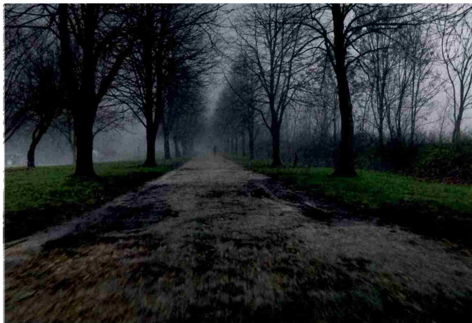
Ne misli, da bo kdaj mimo